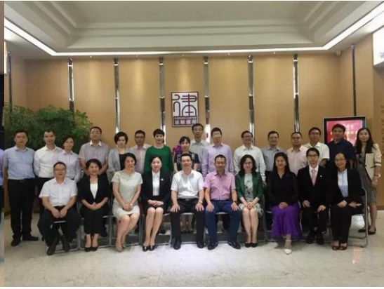
(调研广东法制盛邦(东莞)律师事务所·东莞市)