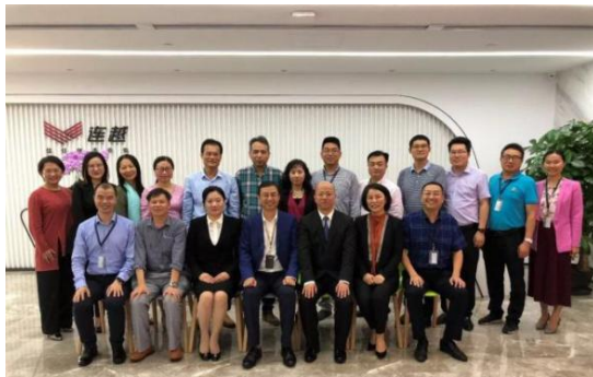
(调研广东连越律师事务所·广州市)