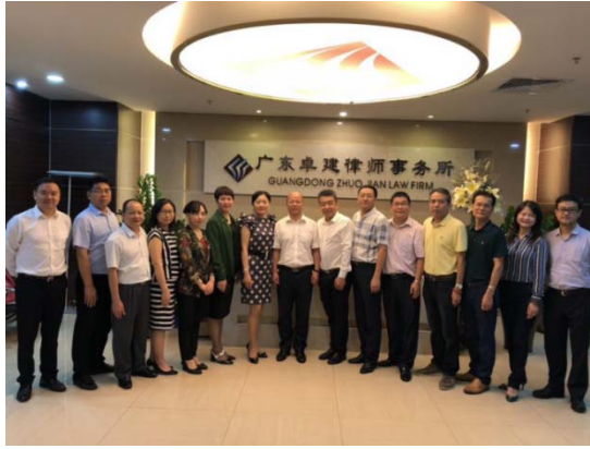
(调研广东卓建律师事务所·深圳市)