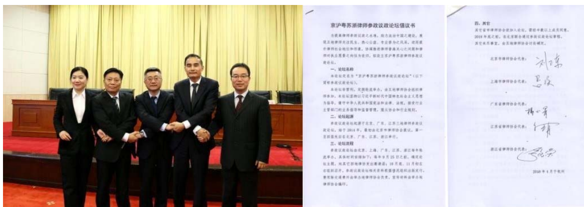
（京沪粤苏浙律师参政议政论坛倡议书）

促成设立“京沪粤苏浙”参政议政全国性论坛，促进五地律师交流合作，学习其他省市参政议政优秀经验，取长补短，有力推动我省律师参政议政工作。