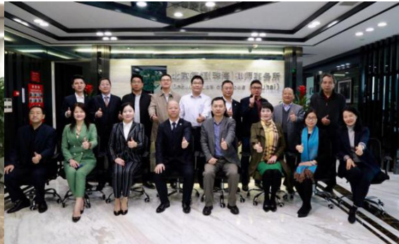
(调研北京德恒(珠海)律师事务所·珠海市)